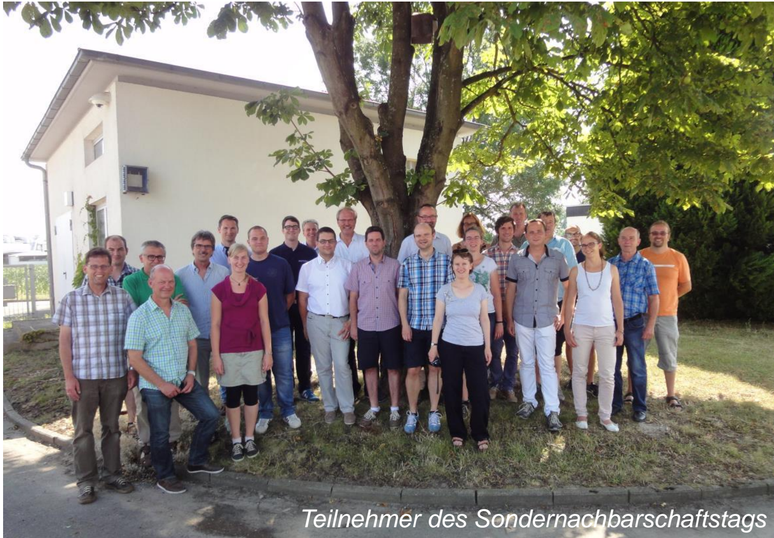
Teilnehmer des Sondernachbarschaftstags