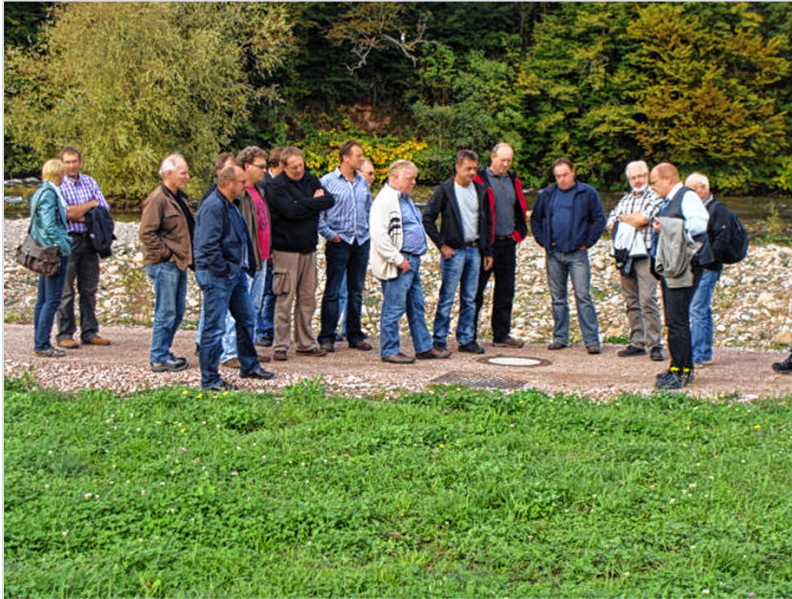
Zur Fortbildung trafen sich Mitarbeiter von kommunalen Kanalbetrieben und der unteren Wasserbeh?